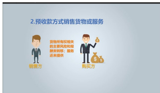
Focusky 动画演示大师自制视频资源