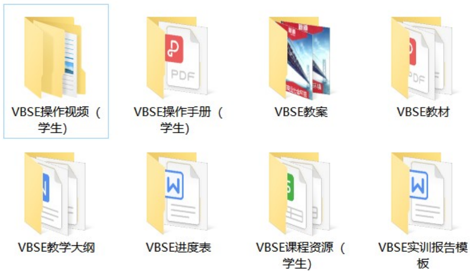
各种教学指导文件、实训指导资料