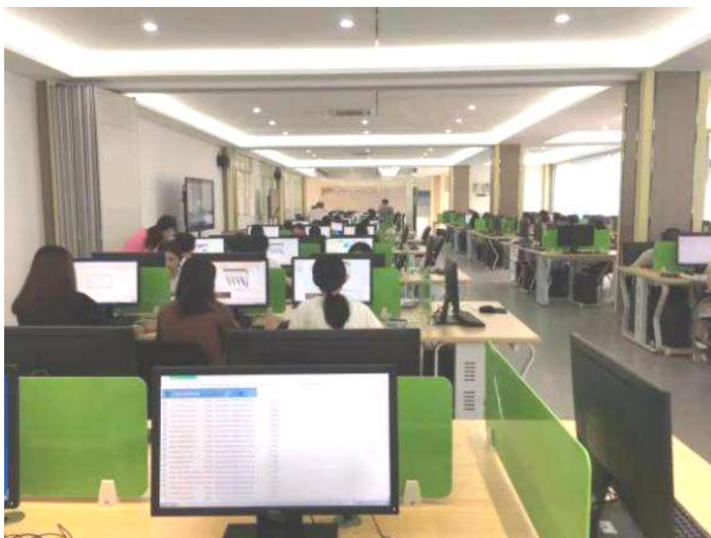
VBSE 主体模拟企业区域