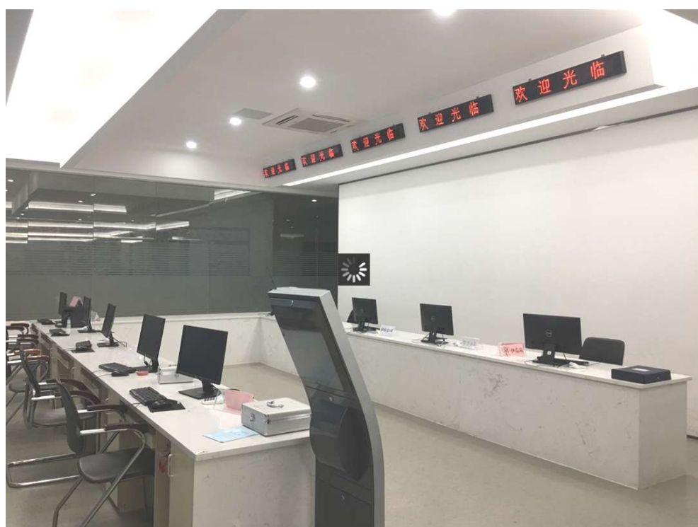
VBSE 外围区（模拟政企服务中心）