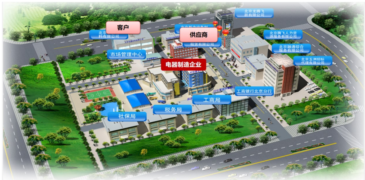
VBSE 实践基地模拟情景图