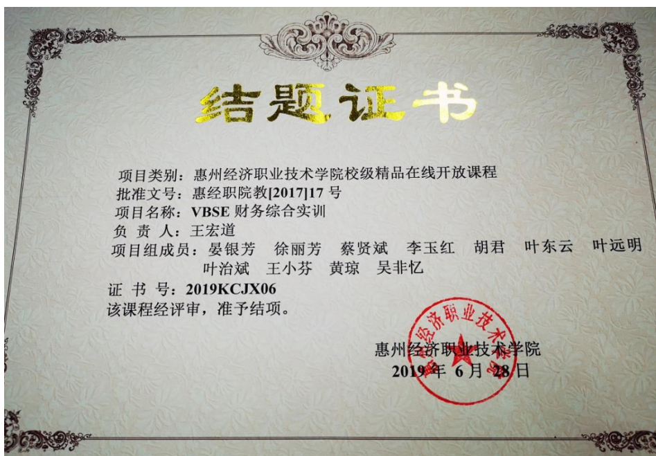
《VBSE 财务综合实训》精品课程结题证书

2018 年全国高等教育教学改革研究课题一般项目（2019 年已结项） VBSE 课程组的相关老师完成了校级精品课程的建设。