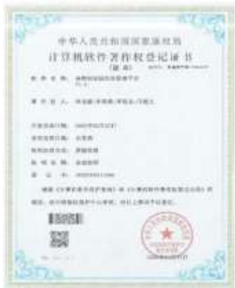
高校创业园信息管理平台