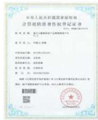
基于大数据的农产品智能推送平台