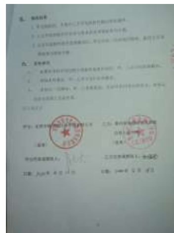
沈顺玲横向课题仓库管理系统软件开发协议