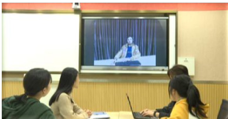
图 2 情景教学