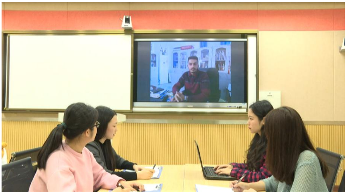
图 10 视频会议