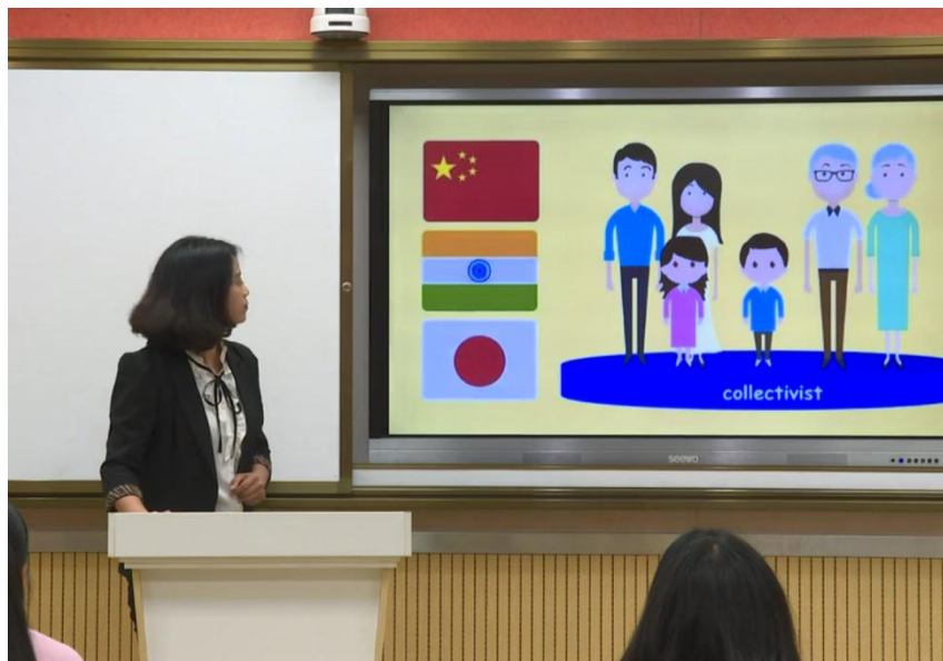
图 6 案例教学