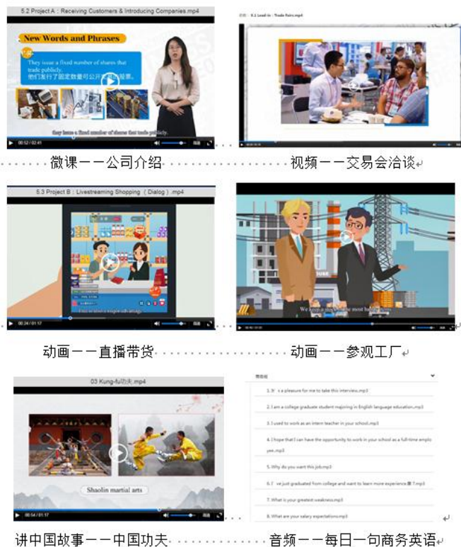
图 7 课程教学资源多样化

教学中合理运用国家级商务英语专业教学资源库“微知库”APP，协助学生自主学习和分组探究，让口语技能的学习变得简单、有趣、易操作，立竿见影有效果，提升学习兴趣和效能感。