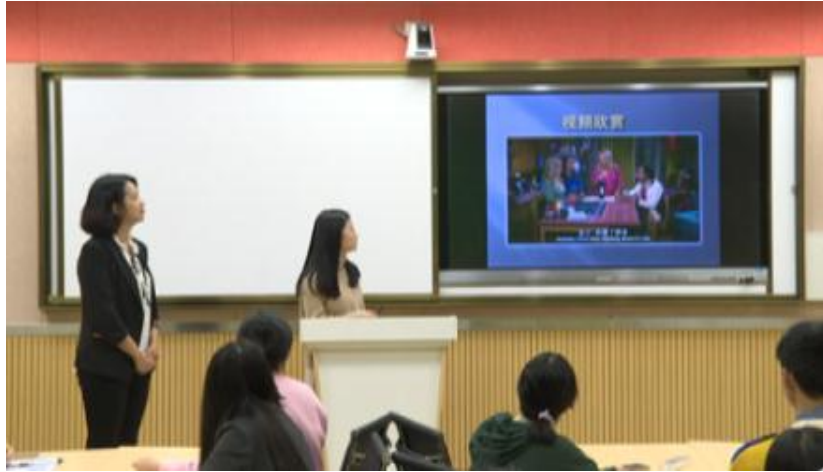
图 4 任务驱动