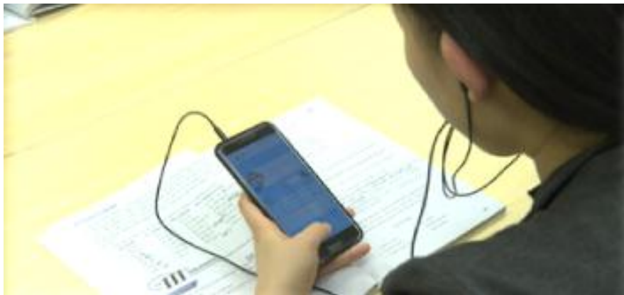
图 5 人机交互口语实训