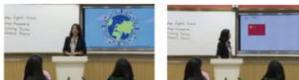
图 3 教学设计中的思政教育