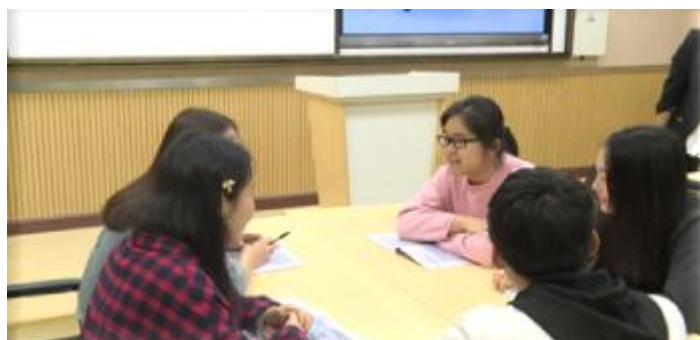
图 3 小组讨论