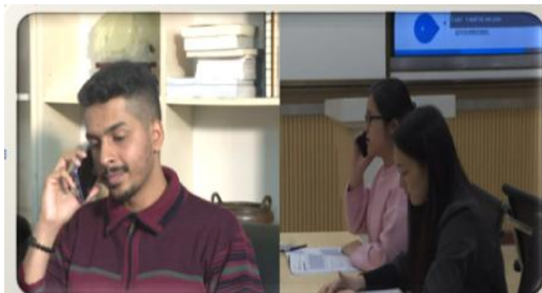
图 1 项目式教学

高职教育重视知识技能培养,应明确以学生为主体、教师为主导的教学理念,在虚拟仿真国际商务环境,组织学生参与实训以获得知识和技能。结合课程性质与内容,探索项目式教学、情景教学、小组讨论、任务驱动、人机交互、案例教学等新的教学法。