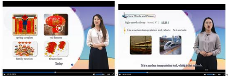
中国传统节日..... 中国高铁