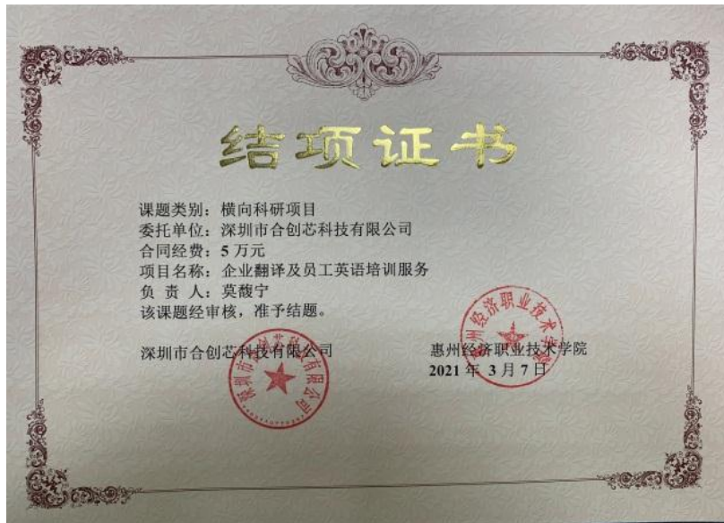
图 3 企业翻译及员工英语培训服务横向课题证书

第三，承担横向课题。课程团队承担企业产品资料翻译和员工英语培训等横向课题服务工作，产生较好的社会效益，课程建设期间横向课题累计进账 13 万。