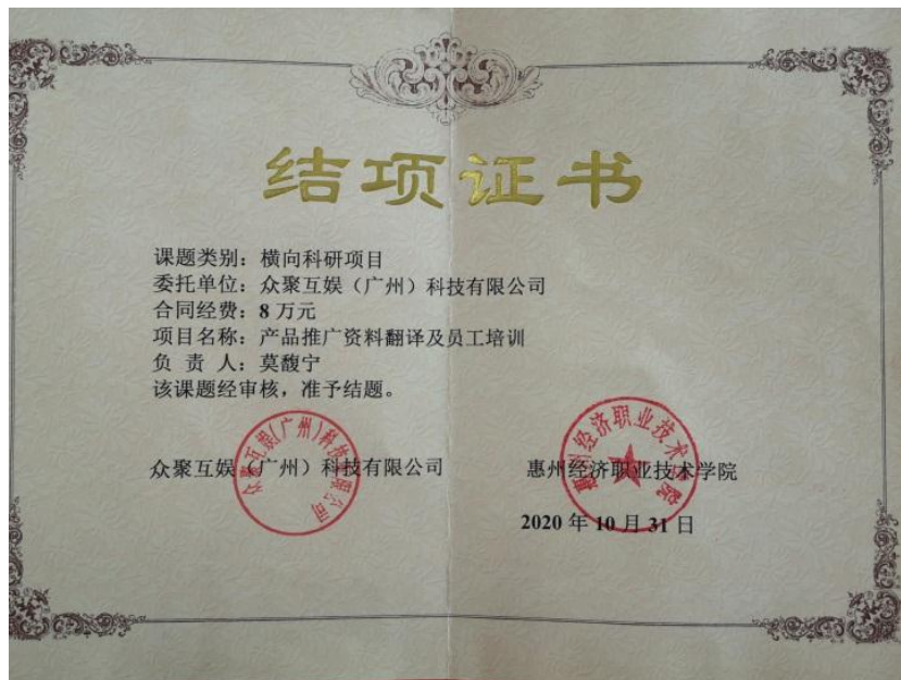
图 4 产品推广资料翻译及员工培训横向课题证书