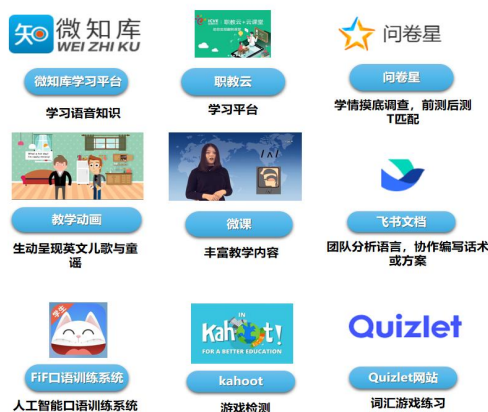
图 6 信息化教学手段

(3) 信息化教学手段得到广泛应用。应用智能 APP、职教云教学平台和多种信息技术手段，让英语学习变得简单，生动有趣，操作强，易实现，增强学生的专业知识积累与提升职业技能，实现专业知识提升、教学技能、实战演练三位一体。