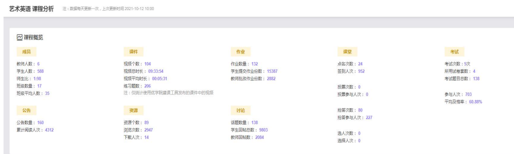
图 3 艺术英语课程分析

《艺术英语》校级精品在线开放课程在 2019-2022 年度在优学院平台建课并开展教学活动。本精品在线开放课程建设推动了课程教学模式的改革，课程建构“导入启发——展示——讲解——练习——后测”于一体的混合课堂教学模式，利用优学院教学平台形成互补式线上线下辅助教学模式，增强了学生的学习兴趣。