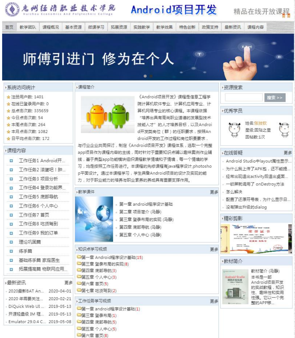
在线课程网站首页