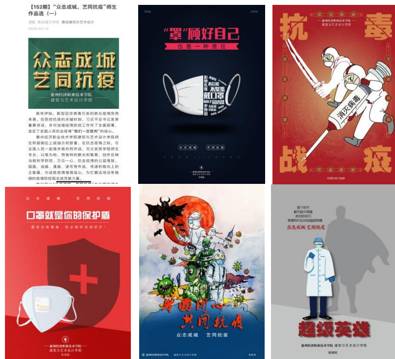
部分优秀设计作品

1、2020年初，面对突如其来的新冠疫情，众志成城，艺笔抗疫，即时组织我系师生创作多幅招贴设计力作，与奋战在抗击疫情一线勇士们共同打响一场“经彩”战“疫”，用设计的力量服务人民，用“艺”己之力，为疫情防控提供文艺支援。其中多幅作品惠州政府单位支持的“抗疫”主题招贴推广公益活动，惠州电台采访播放。