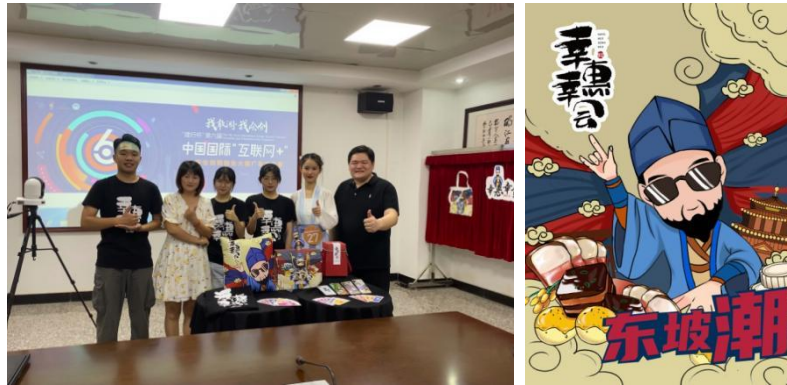
部分优秀设计作品

4、幸惠幸会手信产品海报设计，响应习近平总书记关于“推动中国优秀传统文化创造性转化、创新性发展”的号召，在2020年8月举行中国国际“互联网+大学生创新创业大赛”广告设计专业老师指导《幸惠幸会小铺》获得银奖。