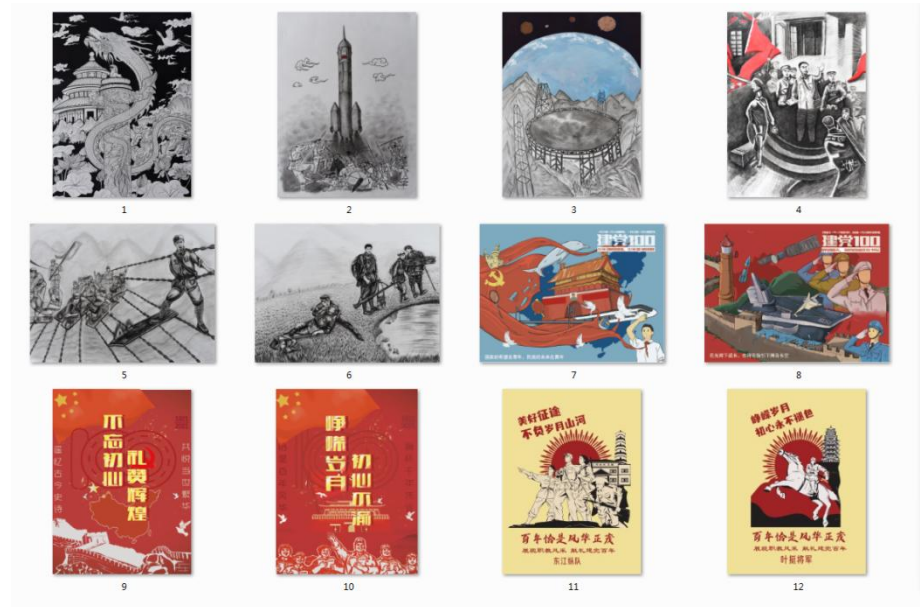
部分优秀设计绘画作品

3、2021年03月，学校图书馆融合广告艺术设计专业课程举办以图书馆阅读为主题的海报设计大赛，招贴课程思政成果的首次亮相，60余幅作品经过教师团队的悉心指导，得到了学院及图书馆各级领导的关注，对作品所表达的主题精神给予了高度评价。